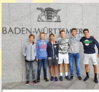
Bundessieger Tennis WK III Jungen 2016