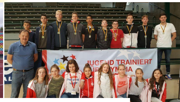
Bundesfinale Jugend trainiert für Olympia Leichtathletik und Basketball 2018